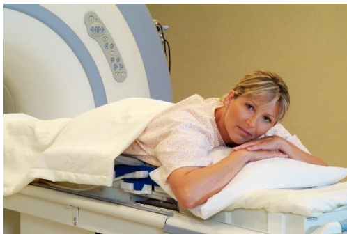
лечение миомы в Израиле

Побочные эффекты случаются редко. К ним относятся чувствительность в области таза, временное ощущение жжения на коже, проходящие боли в ногах.